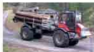
PFANZEL Felix 4-Rad Rückenschlepper, 4 + 6-Rad Rück-/Tragschlepper mit var. Länge