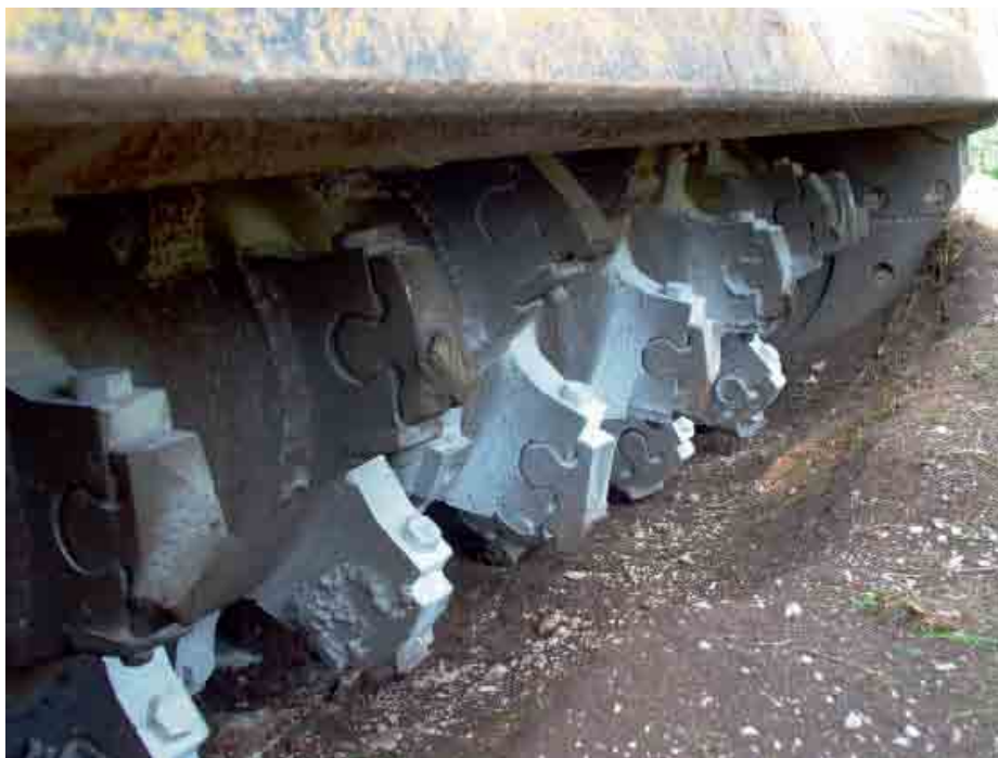
Marteau sur la machine servant au girobroyage

Le canton de Berne, à l'instar des autres cantons de l'Arc jurassien, a donc réglementé la pratique du girobroyage. Moins restrictif que plusieurs de ses voisins, il ne l'a pas interdit. Toutefois, il peut être soumis à une procédure de permis de construire. La commission des pâturages boisés du Jura bernois a reçu le mandat de se pencher sur la question, pour définir les cas où une demande de permis est nécessaire. La fiche établie constitue une aide à la décision qui va dans ce sens. Si l'évaluation en arrive à la conclusion qu'une demande de permis est nécessaire, rien ne permet toutefois de déterminer, à ce stade, si le permis sera délivré ou non. Si une demande de permis n'est pas nécessaire, cela veut dire que le requérant peut exécuter son projet sans autres.