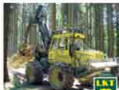
BÄRENSTARK ZUVERLÄSSIG - BEWÄHRT - PREISWERT