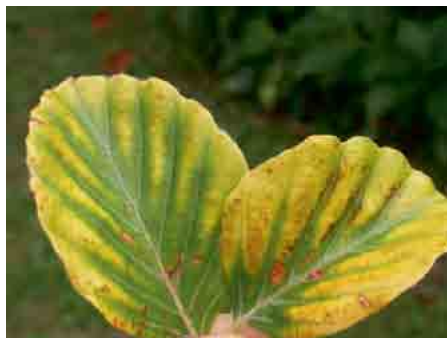
Feuilles jaunies avec carence de magnésium de 40mg/g MS (cela correspond à un manque d'approvisionnement de 60%).

Approvisionnement en éléments nutritifs : chez le hêtre, la chlorose intercostale (symptôme d'un manque de magnésium) a atteint une ampleur encore jamais constatée depuis le début des relevés. Cette évolution est cependant en contradiction avec la carence en magnésium décelée par les analyses dans 50% des placettes en 2007 et seulement 30% des surfaces en 2011. Il est possible que ce paradoxe provienne de la réduction de la surface foliaire.