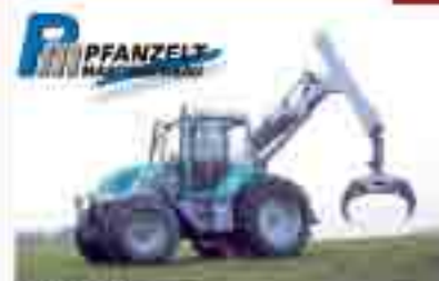
PFANZEL Pm-Trac der vielseitige System- schlepper für Forst- und Kommuneinsatz