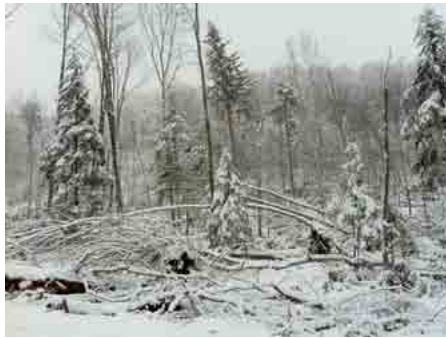
Secteur de forêt de Pierre-Pertuis touché par la tempête Joachim

Environ 20'000 m 3 de bois sont tombés sous les assauts de Joachim. Notre région est, de ce point de vue, la plus touchée du canton : en effet, elle enregistre plus de la moitié des chablis recensés. Le vent soufflait du Nord-Ouest. Il a provoqué les plus gros dégâts au Pont des Anabaptistes, au col du Pierre-Pertuis et au pied du Montoz, particulièrement aux abords des défrichements de l'autoroute A16.