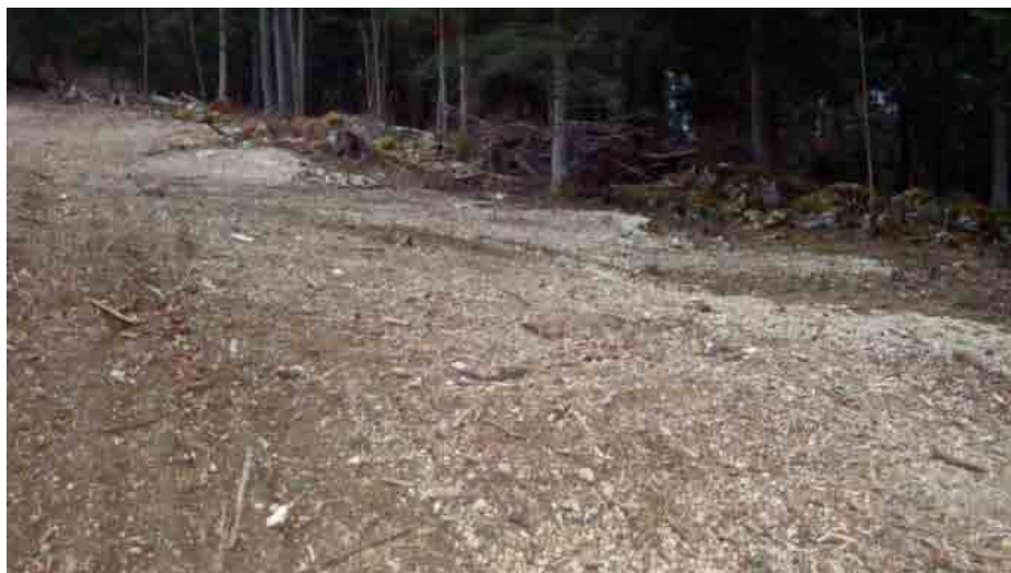
Sol après un girobroyage

Le requérant peut remplir la fiche lui-même ou s'approcher du secrétariat communal qui le guidera. Pour les cas limites, il est préférable de s'approcher de la Préfecture. Dans un deuxième temps, la demande de permis, si elle est nécessaire, suivra la procédure normale connue des secrétariats communaux.