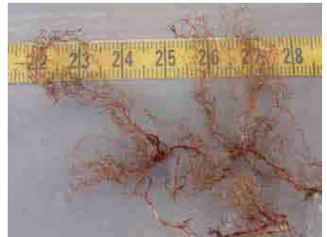
Racines fines chez le hêtre.

Les mesures de la tension de l'eau du sol ont révélé, en 2011, un stress hydrique considérable dans de nombreuses placettes. Ce phénomène a avant tout touché le nord de la Suisse (Glatttal compris), le pied sud du Jura, Genève, le Valais et le Tessin. Concernant les sols très profonds, on a aussi observé le plus grand déficit en saturation d'eau dans les 40 premiers centimètres. A fin juillet, des dégâts de sécheresse ont parfois été constatés sur les feuilles de hêtre, mais cela ne concernait pas toutes les placettes souffrant d'un manque d'eau. Comme stratégie de survie, les hêtres du pied sud du Jura (Champagne) peuvent rejeter leurs feuilles prématurément. Dans cette placette, le hêtre affichait