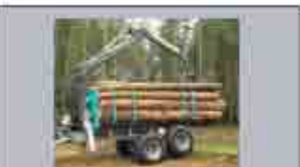
PFANZEL Antrieger von 8 - 15 to