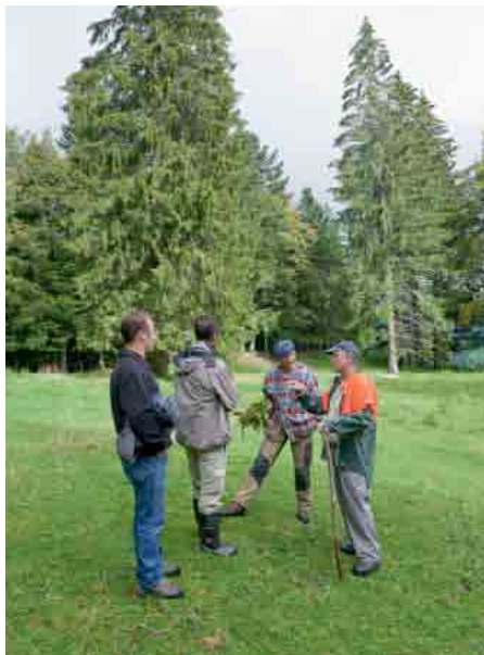
Visite sur le terrain d'un pâturage boisé inscrit au réseau écologique du Vallon de Saint-Imier

Chacun de ces spécialistes a mis en évidence des aspects qui auraient pu échapper aux autres : ici, le rajeunissement forestier est déficitaire; là, les buissons ou autres structures manquent par rapport aux exigences du réseau écologique; ailleurs, il faut trouver une solu-