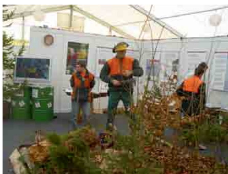
Stand des métiers de la forêt au Salon de la formation de Reconvilier en 2008

Cette manifestation d'envergure offre aux écoliers et à leurs parents la possibilité de mieux appréhender le panel des métiers et des formations professionnelles accessibles dans l'Arc jurassien, en privilégiant la voie de l'apprentissage. De manière plus particulière, le salon de la formation veut également partici-